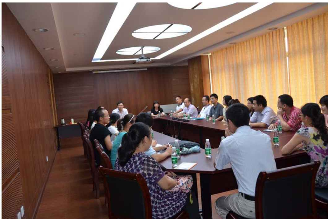
2012级博士生与导师见面会